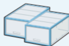
プラスチック衣装ケース