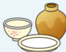
陶磁器・ガラス食器