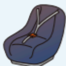
チャイルドシート