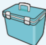
クーラーボックス